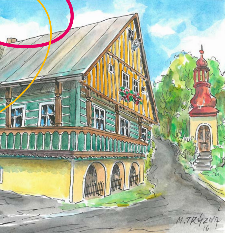
Roubená budova bývalé kovárny v sousedství kapličky