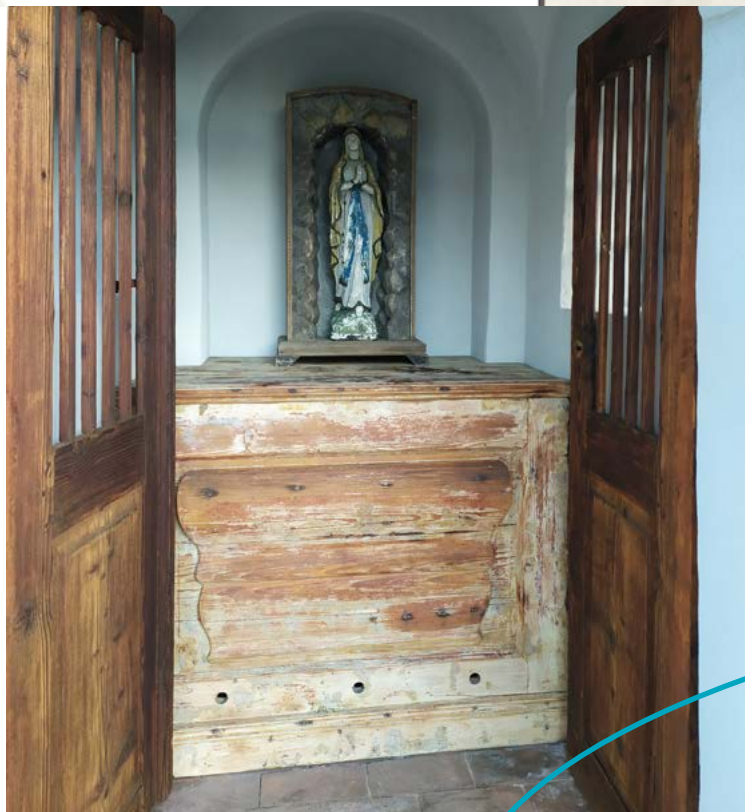
◀ Interiér zrekonstruované kapličky

Do kapliczki z centrum Vrchlabí można dotrzeć spacerem wzdłuż Łaby czerwonym szlakiem turystycznym.